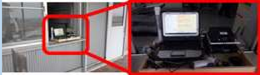
小倉メインゲート